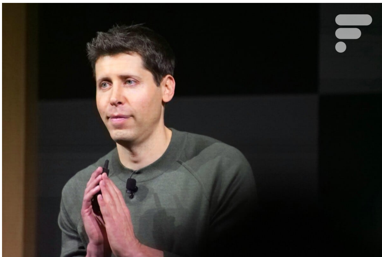
Sam Altman, CEO d'OpenAI

La société OpenAI, sous la direction de Sam Altman, semble se diriger vers le lancement d'un nouveau réseau social, après plusieurs allusions de son PDG.