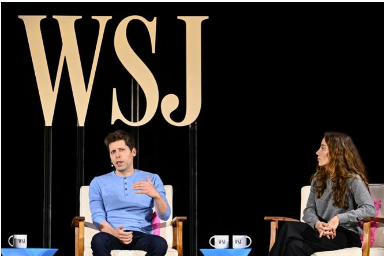
Sam Altman, directeur général d'OpenAI, et Mira Murati, directrice technique de la start-up, lors de la conférence WSJ Tech Live, à Laguna Beach (Californie), le 17 octobre 2023.