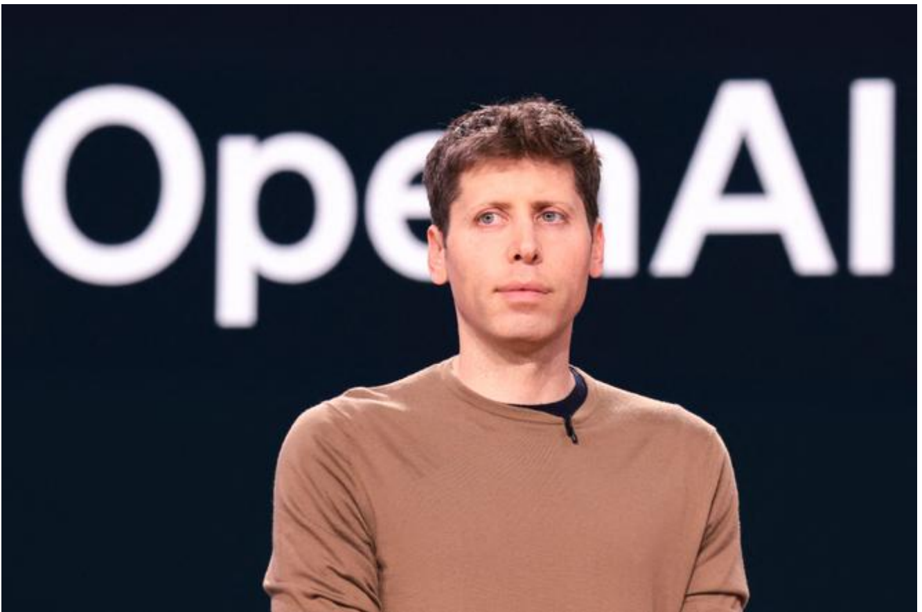
Sam Altman, PDG d'OpenAI, lors de la conférence Microsoft Build à Seattle (Etats-Unis), le 21 mai 2024.

OpenAI lève des fonds record pour renforcer son leadership dans l'Intelligence Artificielle