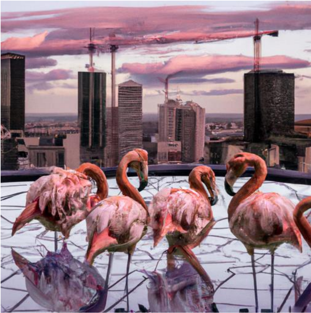
Image créée via un programme d'intelligence artificielle.

Série : L'intelligence artificielle est devenue omniprésente dans notre quotidien. Quels impacts cela a-t-il sur nos sociétés ? « Le Nouvel Obs » vous en parle.